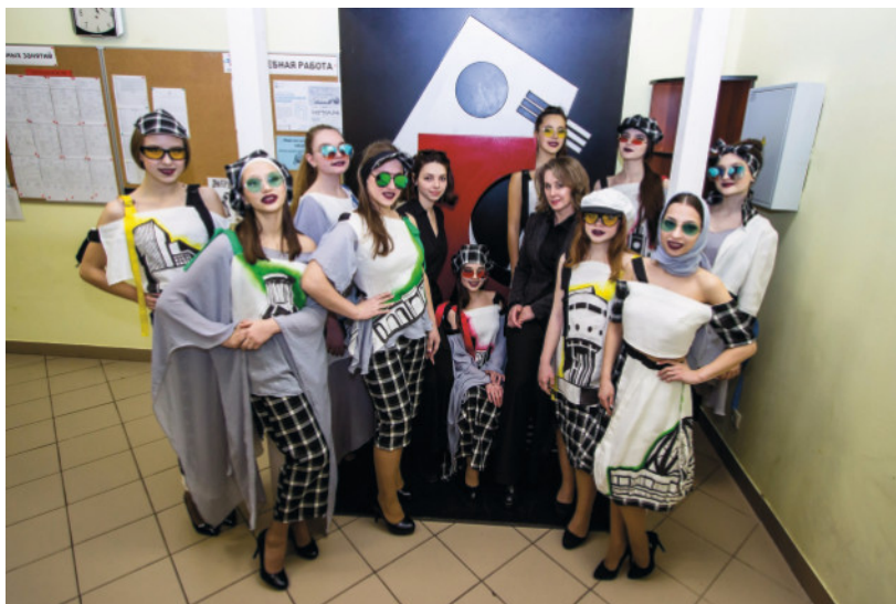
Коридоры ЕАСИ всегда полны ярких красок за счет постоянно создаваемых студентами арт-объектов и коллекций (на фото: открытие выставки молодежного театра мод).

Не менее важным для такого процесса является умение нейтрализовать негативные впечатления от того, что в среде не нравится, сенсорно его перегружает, мешая