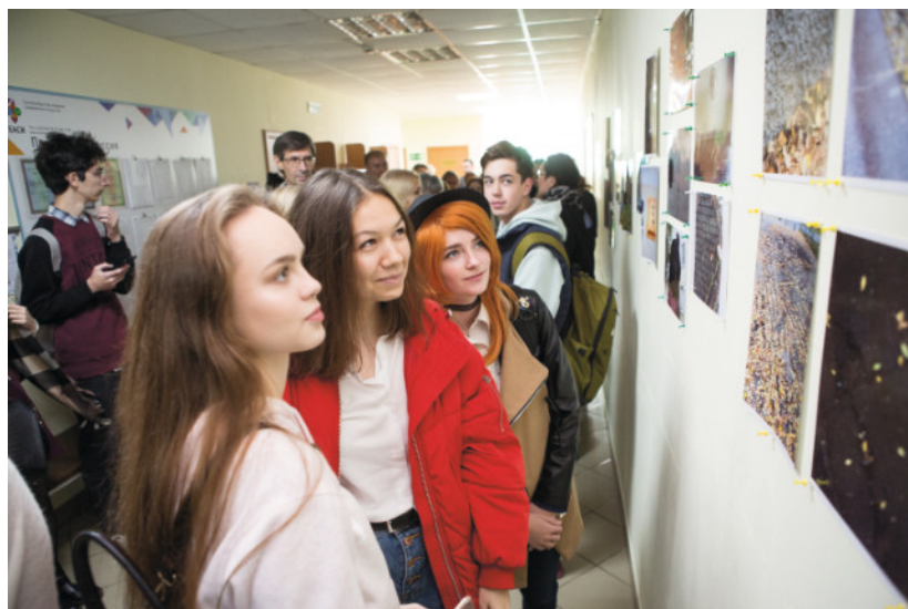
Ежегодно в ЕАСИ проходят Вернисажные дни – уникальная возможность для встречи кураторов и художников сразу нескольких выставок.

Екатеринбургская академия современного искусства – муниципальный вуз, реализующий программы бакалавриата для сферы культуры – максимально использует обе эти возможности для формирования культуры невербального общения студентов и культуры общения в целом. Студенты первого-второго курсов изучают и практикуют осознанное формирование культуры невербального общения на дисциплинах, связанных с коммуникацией и психологией общения: теория и практика коммуникации, деловое общение, социальная психология. Опрос студентов первого курса на протяжении последних пяти лет (2017-2021 гг.) выявил некоторые закономерности, связанные с невербальным общением и его культурой. Во-первых, из года в год студенты проявляют неизменно высокий интерес к знаниям средств невербального общения и способам их воспроизведения (от 85% в 2017 году до 93% в 2021 году). Во-вторых, у студентов возрастает же-