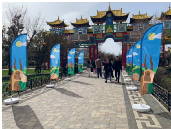
Рис. 7. Преобразование городских локаций к празднику (тематические фотозоны, украшение торговых точек, тематические мероприятия в ресторанах).