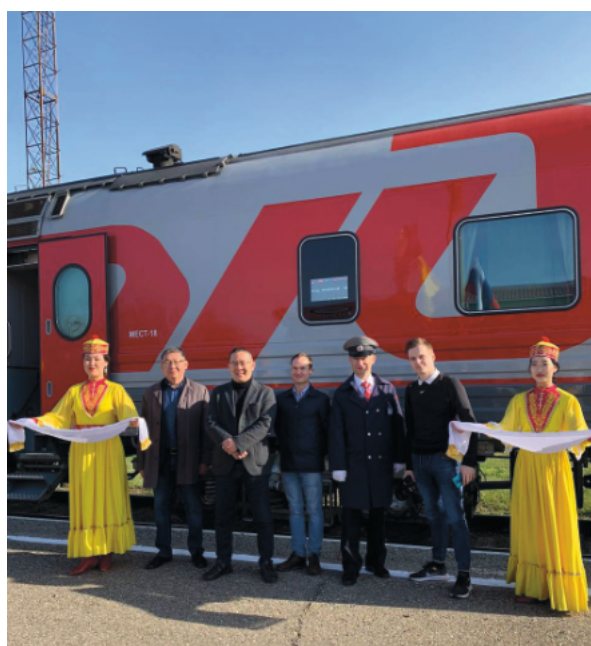
Рис. 2. Встреча гостей, прибывших на железнодорожную станцию «Элиста».

Фестиваль «Тотем» — это праздник дружбы, доброты и взаимопонимания. Он позволяет показать свою культуру широкой публике и познакомить с национальными традициями гостей, приехавших в Калмыкию. На фестивале языческой культуры участников познакомят с некоторыми древними калмыцкими об-