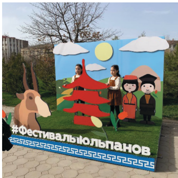
Рис. 4. Фирменный стиль и сайт мероприятия.