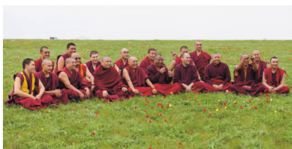
Рис. 5. Вовлечение горожан и бизнеса в проектирование мероприятий.

3. Открытый город характеризуется доступом представителей заинтересованных сообществ к управлению и открытостью властей по отношению к населению и туристам. Информационная открытость обеспечивается посредством официальных сайтов и групп в социальных сетях, разнообразными форматами поддержания обратной связи, реализацией проектов участия горожан в проектировании, регулярным мониторингом обратной связи от гостей города и учетом замечаний при дальнейшем планировании развития городской среды и проектировании контента событийных мероприятий.