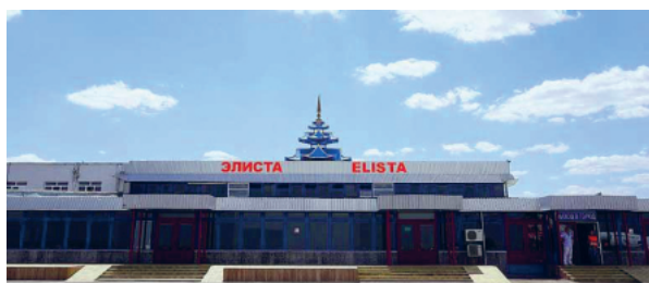
Рис. 1. Международный аэропорт федерального значения «Элиста».

Ежегодно в Калмыкии проводится гастрономический праздник «МаханFest», посвященный национальным блюдам Калмыкии. Традиционная кухня калмыков – это изобилие мясных и молочных блюд. Республика