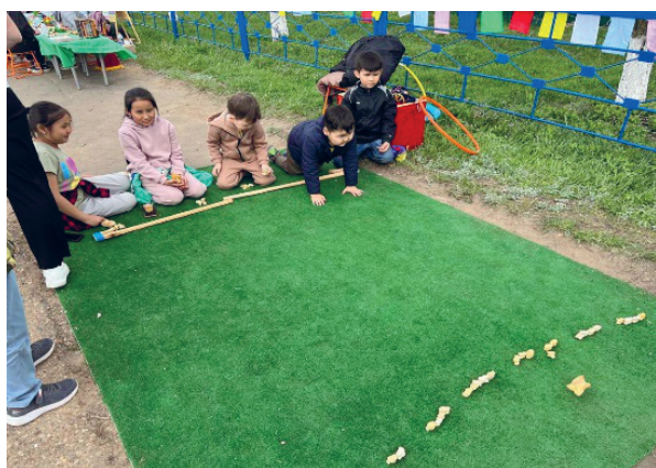
Рис. 3. Общественные пространства для проведения массовых мероприятий – в свободном доступе для всех.