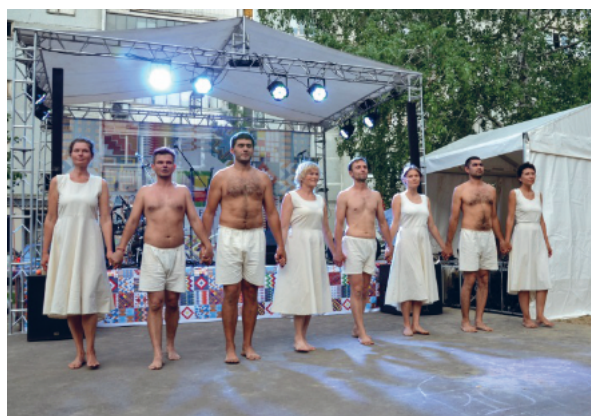
Рис. 3. ЭКА театр «Антоновка». Спектакль " Найденные крылья", выступление на фестивале Двор UnityFest в Казани 2019 г.