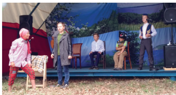
Рис. 1. Выступление детского коллектива ЭКА театра «Антоновка» со спектаклем «Слон живописец» на празднике Сабантуй в Камско-Устьинском районе, 2020 г.