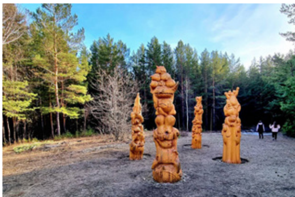
Рис. 2. «Городские идолы», автор Наталья Пастухова 13

Четыре отдельно стоящие круглые скульптуры из сосны появились на склонах Уктусского лесопарка в августе. Объекты образуют единую закольцованную композицию.