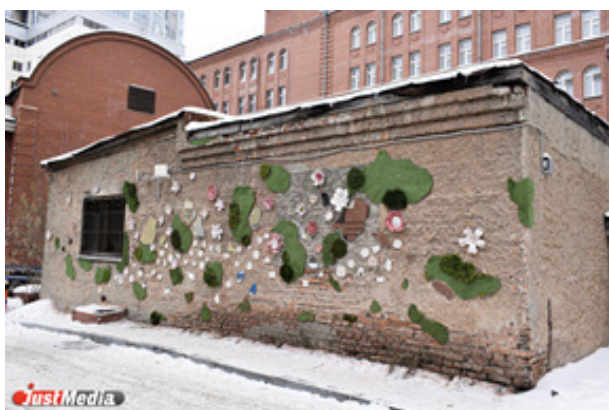
Рис. 5. Арт-объект «Навсегда», авторы Галина Белова и Маргарита Хаак 16

Статья из «Комсомольской правды – Екатеринбург» предлагает трактовку материалов: «Каждый материал на арт-объекте символизирует определенные вещи. Например, зеркала – уральские озера, а глина, из которой сделаны памятные таблички, – символ долговечности». Эта трактовка выросла из предложенного организаторами пресс-релиза и слов художниц, соб-