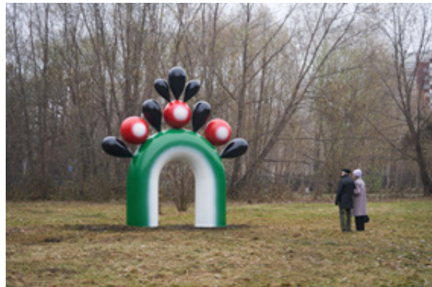
Рис. 8. Арт-объект «Портал», автор Красил Макар 19

Арт-объект выполнен двумя художницами – Людмилой Калиниченко и Ксенией Лариной. Он установлен на одном из пирсов Верх-Исетского пруда. Эта работа вызвала наибольший отклик