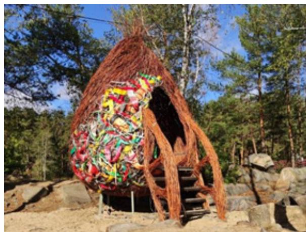
Рис. 3. Арт-объект «Техногенное гнездо», автор Вера Ишутинова 14

характеристики работы: «Гнездо представляет собой четырехметровую инсталляцию, сплетенную из веток, старых стяжек и тяжелых проводов. В него могут поместиться до 10 человек».