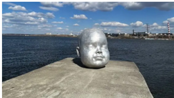
Рис. 9. «Индустриальный младенец», Арт-группа LKKL 20

в СМИ: в указанных в статье медиа «Индустриальному младенцу» арт-группы LKKL посвятили 18 материалов. Поводом для пяти из них стало высказывание Оскара Кучеры, назвавшего арт-объект «сатанизмом». Один текст анонсирует аудиоспектакль, вдохновленный скульптурой, один текст посвящен мечту. Все эти тексты освещают косвенные темы. Остановимся на статье