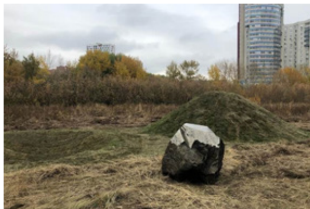
Рис. 4. Арт-объект «Самородок», автор Екатерина Рейшер 15

Журналистка портала 66.ru Владислава Ямщи-