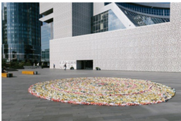
Рис. 1. Объект «Вытирайте ноги, проходите». Анонимный художник 12