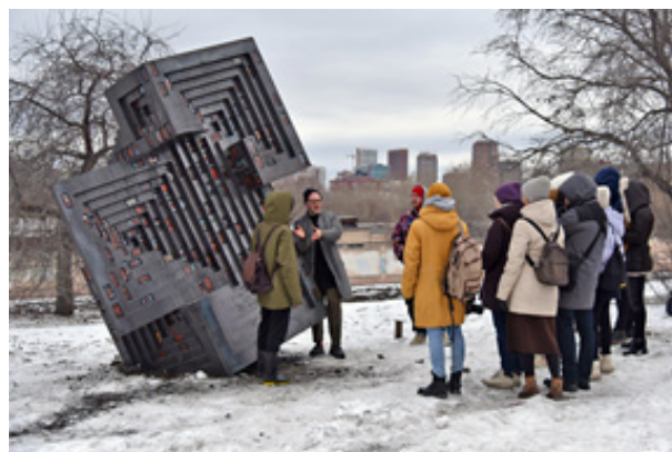
Рис. 6. Арт-объект «Визмут», Арт-группа ХО ГУИ 17

Корреспондент «Комсомольской правды – Екатеринбург» в статье кратко фиксирует расположение и материальные характеристики арт-объекта, рассказывает историю его создания с применением цитат художников и организаторов фестиваля. Текст портала