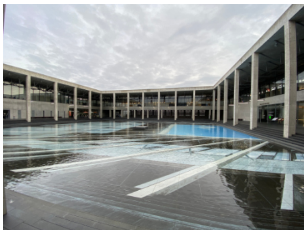
© Фото: Е. Я. Кенигсберг, 2022.