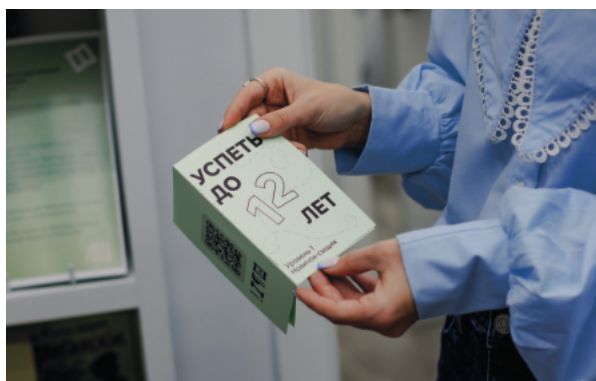
Рис. 7. Проект «Успеть до 12».

Проект «Рабочее место писателя. Детство» – творческая лаборатория, погружающая детей в сферу писательства. Встречи включают чтение коротких рассказов, мозговой штурм «Придумываем свою историю», а затем – печатание собственного текста на печатной машинке (или набор на компьютере). Ребёнок становится автором, его текст торжественно зачитывается вслух, и он получает свой напечатанный экземпляр. Продуктом проекта является самиздат: небольшие книжки, созданные детьми, которые хранятся в библиотеке и доступны для чтения другими посетителями.