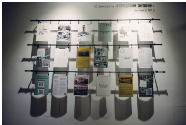
Рис. 3. Инсталляция «Голос города».